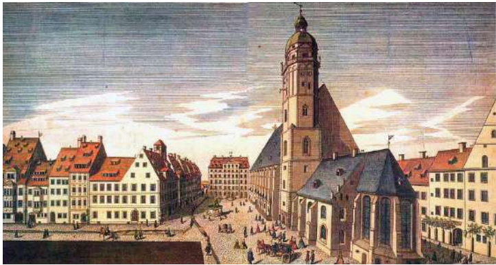
萊比錫聖湯瑪斯學校（中心）及教堂（右）（版畫，1735）

終其一生，巴赫的管風琴家名氣在當時始終大過於作曲家身份，僅有少數作品於他在世時出版。儘管巴赫的作曲並未在當時受到如同今日般的重視，但他的作品被後繼作曲家如莫札特、貝多芬等人讚賞。1829年，當孟德爾頌重新介紹演出《馬太受難曲》後，巴赫的作品與藝術成就終獲廣大肯定，被視為古典音樂最偉大的作曲家之一。