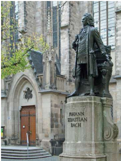
聖湯瑪斯教堂前的巴赫像

綜觀巴赫所處的時代背景，當時政治上各方王公貴族各據一方，效法法王路易十四對精緻藝術與奢華生活的追求，在經濟上提供音樂家支援；在宗教上，日耳曼宗教分立，對神學的探討蓬勃，無論階級、宗教皆深刻影響著人民的生活，作曲家用自身的才能展現對信仰的虔誠與奉獻，用音樂、藝術榮耀上帝；至18世紀初期啟蒙運動興起，再再促成了一個奔放的環境，百花齊放。音樂上，巴赫是個令人神迷的說書人，擅長用旋律帶領聽眾進入另一個世界。他的作品風格融入歐洲各國的風格，使用對位與多聲部的旋律對話、賦格及變奏等，展現了音樂的豐富可能性。巴赫不僅是巴洛克時代最重要的作曲家，也是古典樂壇不朽的一代大師。