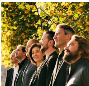
維也納 K+K 音樂平台室內樂團 PLATFORM K+K VIENNA

出生於聖彼得堡，以抒情與花腔女高音角色而聞名，最著名是出演羅西尼與莫札特的歌劇。2007 年贏得「多明哥國際歌劇大賽」銀牌獎後開啟國際舞台的展演，受邀參與世界重要歌劇院及音樂廳的歌劇演出。2009 年與加拿大劇場鬼才導演 Robert Lepage 合作史特拉汶斯基《夜鶯之歌》，奠定世界頂尖女高音地位。2022/23 樂季，擔綱由 David McVicar 導演、賽門·拉圖爵士指揮的莫札特歌劇《克里特王依多美尼歐》中的阿果司公主依蕾特拉一角，於柏林國家歌劇院演出。