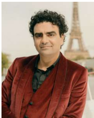
羅蘭多·費亞松 ROLANDO VILLAZÓN / 男高音

被譽為世界十大男高音之一，出生於墨西哥市，集合音樂家、導演、小說家、藝術總監及廣播、電視訪賓等多重身分，是當今全球頂尖的藝術家。1999 年贏得「多明哥國際歌劇大賽」查瑞拉歌劇獎與觀眾獎，以獨特的演繹征服世界各地最重要的舞台，確立樂壇巨星地位。《泰晤士報》稱頌他是「當今最迷人的男高音天王」；《南德意志報》則盛讚他「擁有最雄偉的歌聲——大器磅礴，優雅又充滿力量」。執導次女高音巴托莉領銜的《塞爾維亞理髮師》，獲得國際樂壇廣泛好評。2022/23 樂季，費亞松與導演切尼亞科夫、指揮蒂勒曼合作華格納《指環》，詮釋《萊茵的黃金》中火神洛哥一角。與指揮畢凱特合作蒙台威爾第的《奧菲歐》。費亞松更是 2023 年的薩爾茲堡莫札特週策展人，屆時將與維也納愛樂共同演出莫札特《安魂曲》。