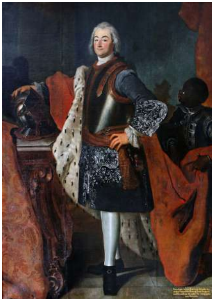
柯騰公爵——理奧波德王子（Prince Leopold）

1722年，巴赫與包括格勞普納（Christoph Graupner，1683-1760）其他四位競爭者競爭萊比錫湯瑪斯教堂音樂指揮的職位空缺，在漫長的徵選後，巴赫取得這個非同小可的職位。聖湯瑪斯教堂唱詩班音樂指揮在萊比錫等於是全城大小教堂的音樂總監，但也受許多政府單位管轄；加上安娜在柯騰宮廷本是事業有成的女高音，但到了萊比錫就無法參與教堂工作；自由度與限制比柯騰時期繁重許多。然而萊比錫有聖湯瑪斯學校及知名大學，不失為孩子們求學的好地方；而巴赫在第一任妻子芭芭拉過世後，決心專注教堂音樂創作。在多方考量下，巴赫接受了萊比錫的工作，並且要求也在湯瑪斯學校任教。